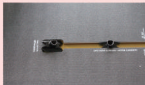
レールの方向に向かってパーツを2個ずつはめ込む。

取り付けの前に、ボード自体にビス穴にパーツを入れる必要があります。左記の手順後、最後にしっかり溝に合わせてキャップをはめ込みます。