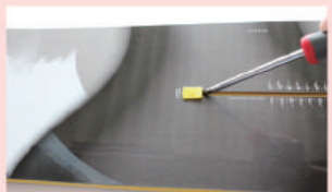
ドライバー等でキャップを外す。(※ボードを傷つけないようご注意ください。)