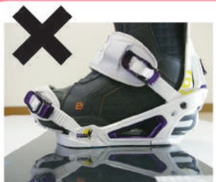
ボードに対してかかと側に寄りすぎている。

Process 1 スノーボード(以下ボード)にビンディング(以下BD)を取り付けるスタンス幅を測ります。ボード自体の推奨ポジション、または肩幅位を目安にしてください。実際に滑走してみて自分に合ったスタンス幅を見つけてください。