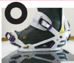
ブーツがボードのセンターに合っている。